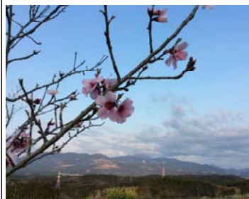
←霧島連山を背景に 花を拡大してみると

弊社では今年も可愛いアーモンドの花が咲きました。 一気に春が訪れた様で、心なしか気分も弾みます。